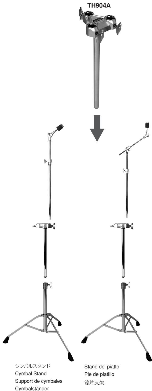
シンバルスタンド Cymbal Stand Support de cymbales Cymbalständer

■ 使用方法 / ■ Setup / ■ Mise en œuvre / ■ Setup / ■ Installazione / ■ Montaje / ■ 安装